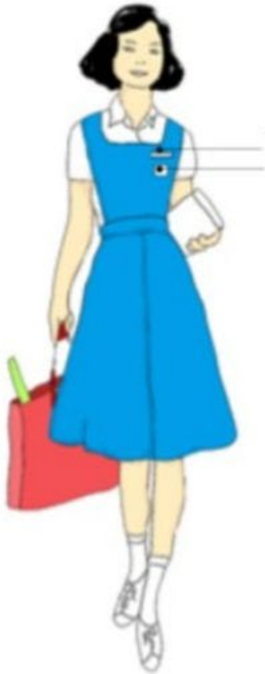
Memakai Penafor dan Blaus