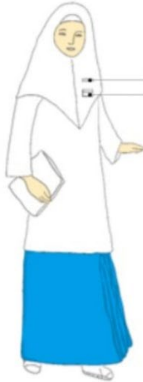
Berbaju Kurung, Berkain Sarung serta Bertelekung Mini