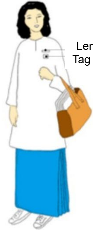
Berbaju Kurung dan Berkain Sarung